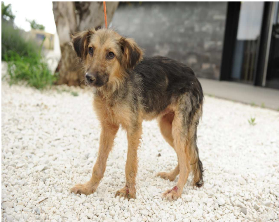
Adelgazamiento y mal estado general en un perro.